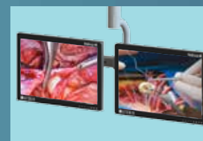
Bras ressort et support-écran simple ou double