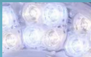
3 500 K - 4 000 K 4 500 K - 5 000 K