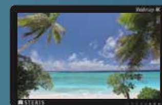
Ecrans disponibles en HD ou 4K de 31" à 65"