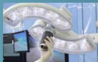
Poignée HD caméra